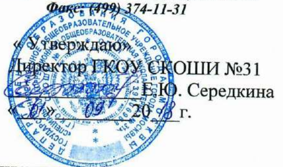
График работы спортивного зала